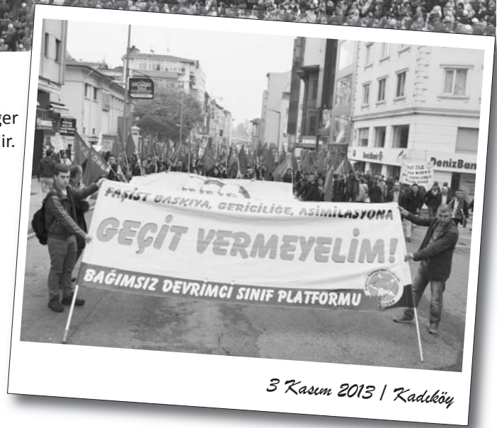
3 Kasım 2013 | Kadıköy

Alevi emekçiler bugünkü sorunlarına çözüm bulmak istiyorlarsa geçmişteki tarihsel deneyimlerine bakmalı ve “bozuk düzende sağlam çark” olacağını iddia edenlere kanmamalıdır. Alevi emekçilerin yolu Pir Sultanlar’ın yolu olmalı ve sermaye düzenine karşı